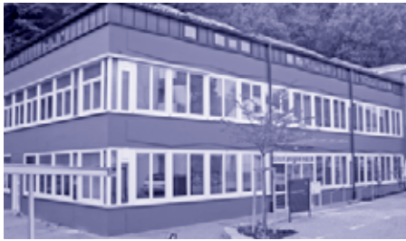
Die Torwiesenschule in Stuttgart-Heslach wird weiter ausgebaut

Ein eigener Jahresbericht wäre nötig, um alle Aufgaben des Facility Managements einzeln aufzuzählen: Die Mitarbeiter des für Immobilien und Anlagen zuständigen Bereiches stemmen mehrere Großbauprojekte, verwalten Tausende technische Gebäudeanlagen, kümmern sich